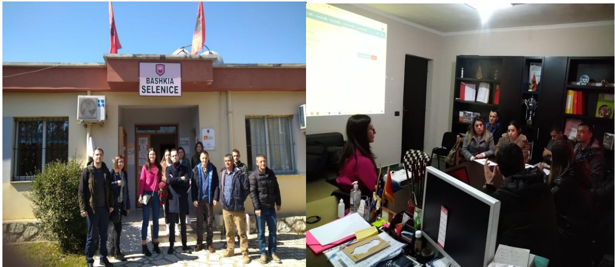
Foto gjatë vizitës në Bashkinë Selenicë

Në fund të kësaj vizite dy-ditore morëm më shumë informacion nga situata në këto bashki. Gjatë diskutimeve u dhanë shumë ide të cilat do të merren në konsideratë për zhvillimin e mëtejshëm të Kadastrës Fiskale. DPTP dhe ProTax janë falenderues për njohuritë e shpërndara dhe kontributin e dobishëm të secilit pjesëmarrës në takim.