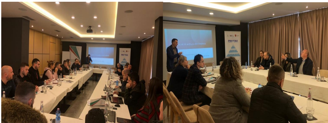
Foto gjatë vizitës në Bashkinë Vlorë

Palët mbeten të angazhuara për të vazhduar me zbatimin e proceseve sipas planit të aktiviteteve në përbushje të objektivit të Bashkisë Vlorë.